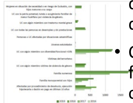
Distribución de las concesiones por grupos de especial atención