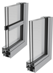
ARS-72 C16 Mínima